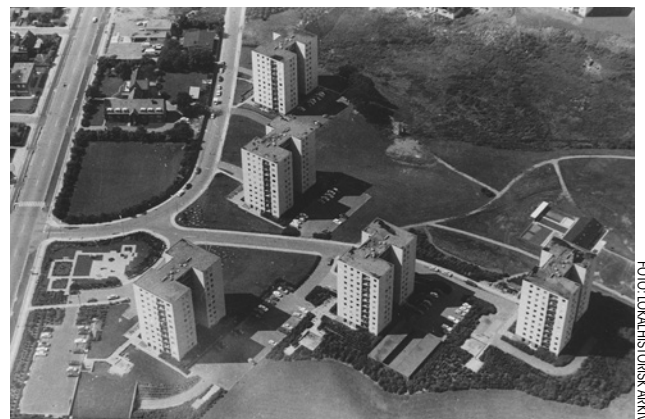
Luffoto over Vestbyen, hvor højhusene bygges på Lumbyesvej, 1971.

I løbet af godt 30 år opførte LAB omkring 2000 lejligheder i Fredericia. LAB gik fx i gang ved Lumbyesvej og Rygårdsvej, hvor Vaseparken blev opført. Efterhånden rejste der sig otte næsten ens moderne højhuse i området. Her kunne familier bo for sig selv uden at skulle dele bolig med andre.