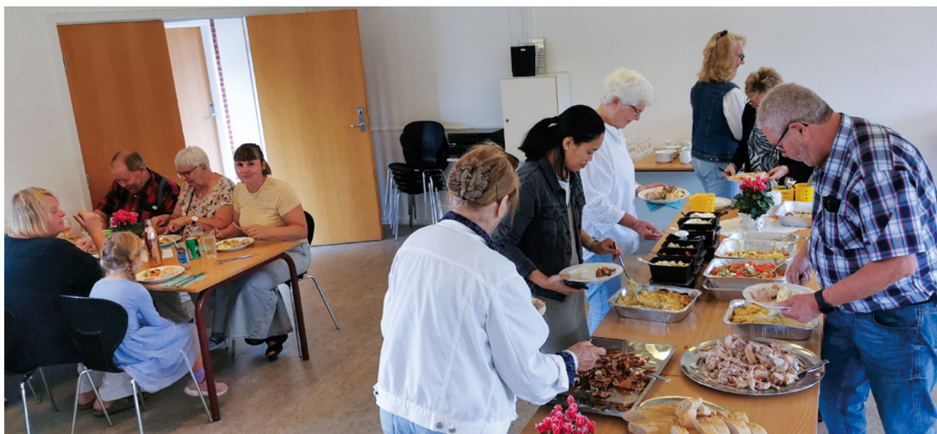
Årets fælles sommerfest i 218 og 220 blev en succes med god stemning hele vejen rundt, uanset om man kom fra 218 eller 220.

"Ingen af afdelingerne kommer derfor til at betale for den anden ved sammenlægningen. Men kommende