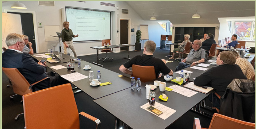
Det seneste "Vedligehold af boligen"-kursus i juni var fuldt booket med 20 deltagere.

Udover disse kurser bliver der i 1. halvår 2025 afholdt "Hjertestarterkursus" for alle lejere – og kurset "Vedligehold af boligen" for afdelingsbestyrelsers medlemmer.